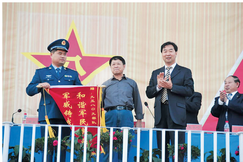
院领导为参训官兵授旗