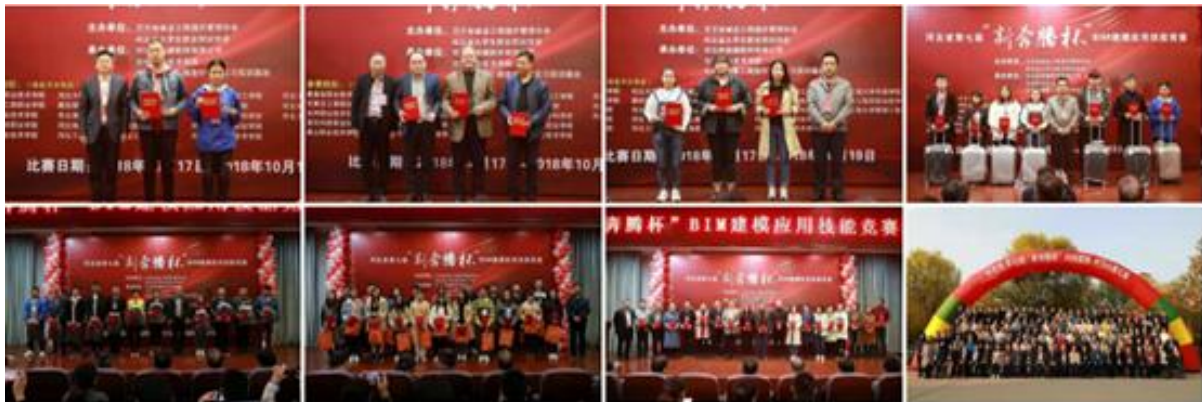
(城乡建设工程系 葛志华供稿)

通过这次比赛，我们不仅取得了可喜的成绩，还与其他院校进行了知识和实践技能的交流，以比赛为契机，相互学习、相互促进，使老师和学生都收获满满。