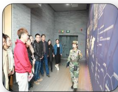
（马克思主义学院 李月妍供稿）