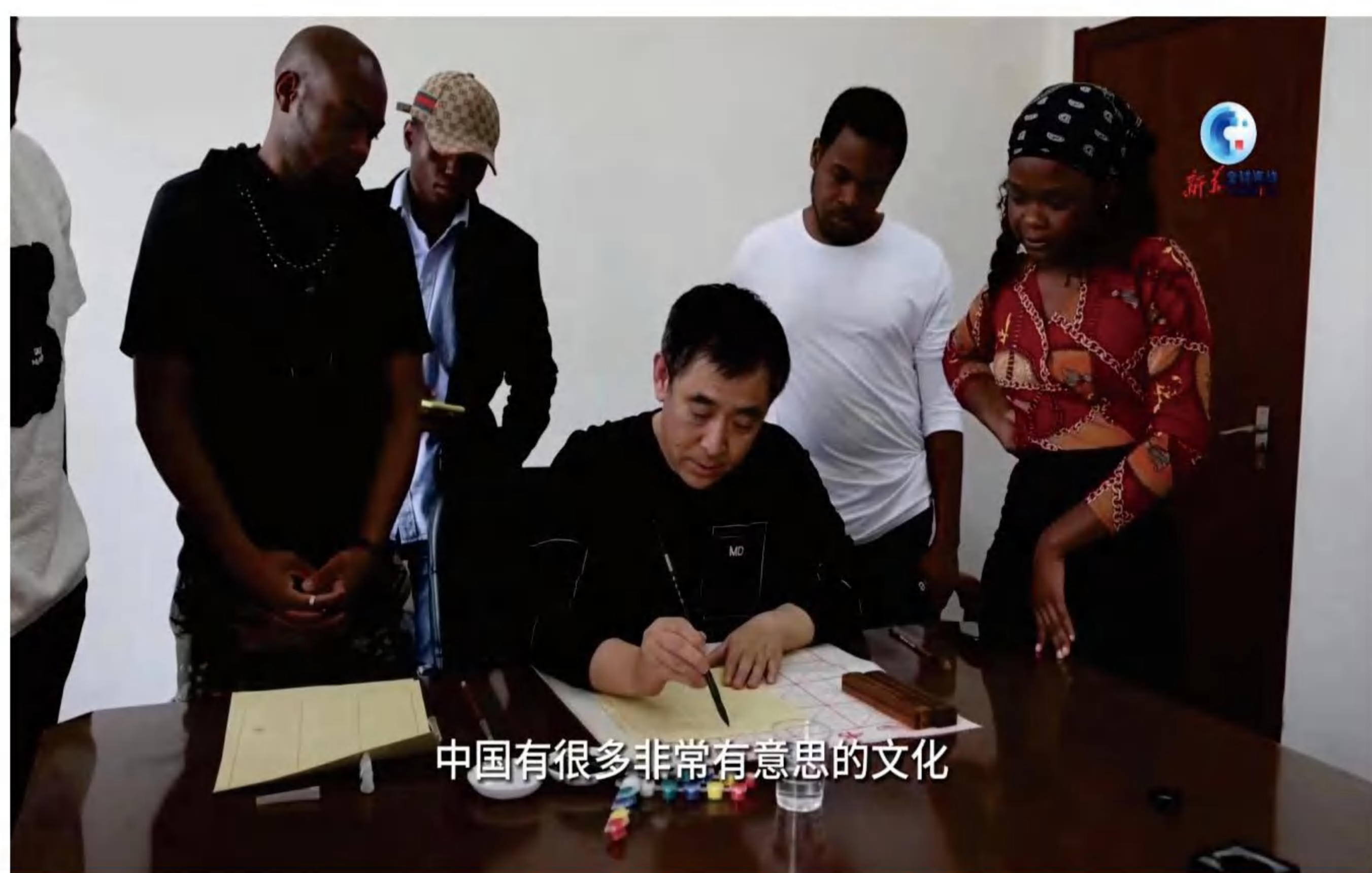
中国有很多非常有意思的文化