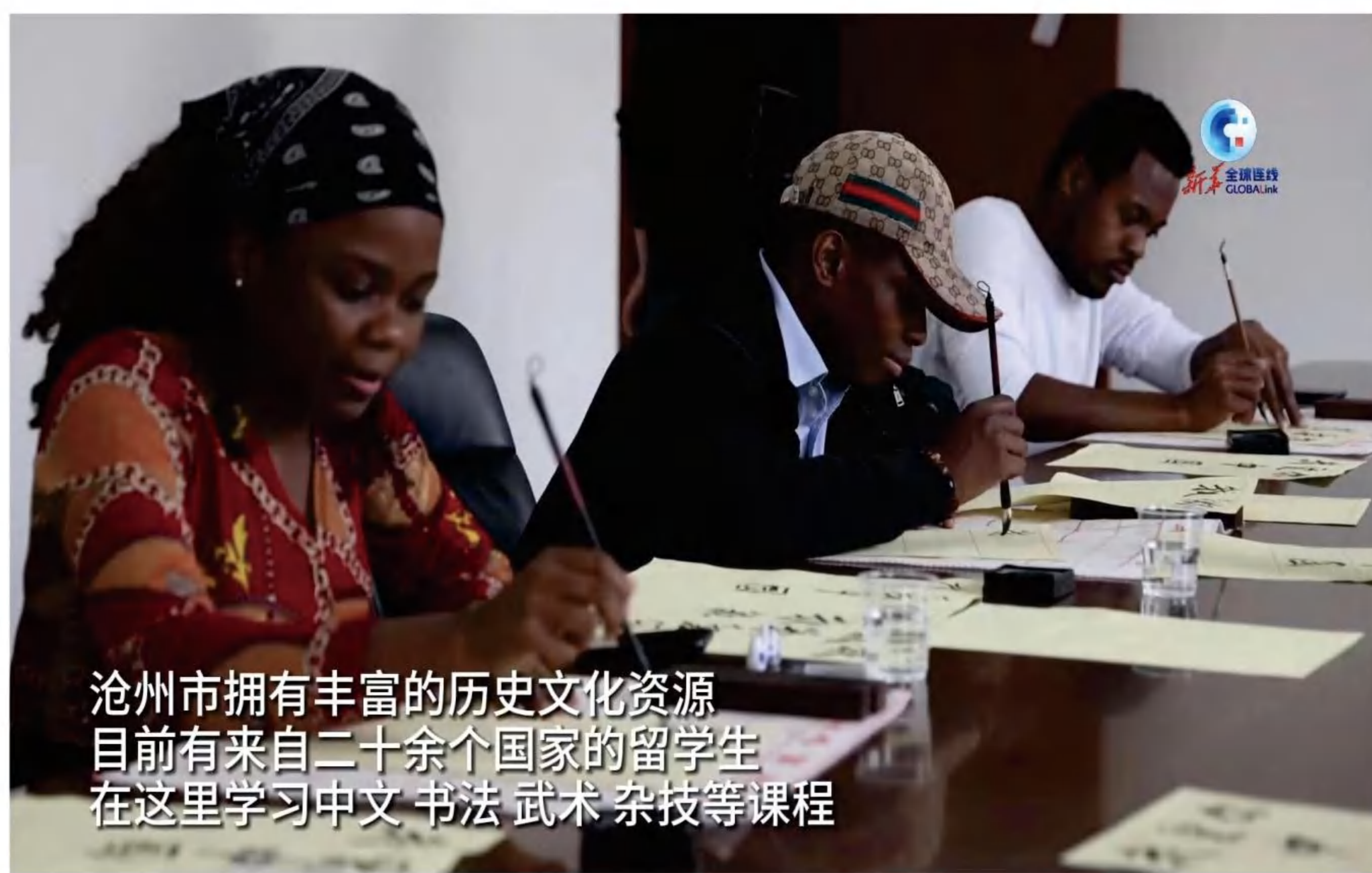
沧州市拥有丰富的历史文化资源 目前有来自二十余个国家的留学生 在这里学习中文 书法 武术 杂技等课程