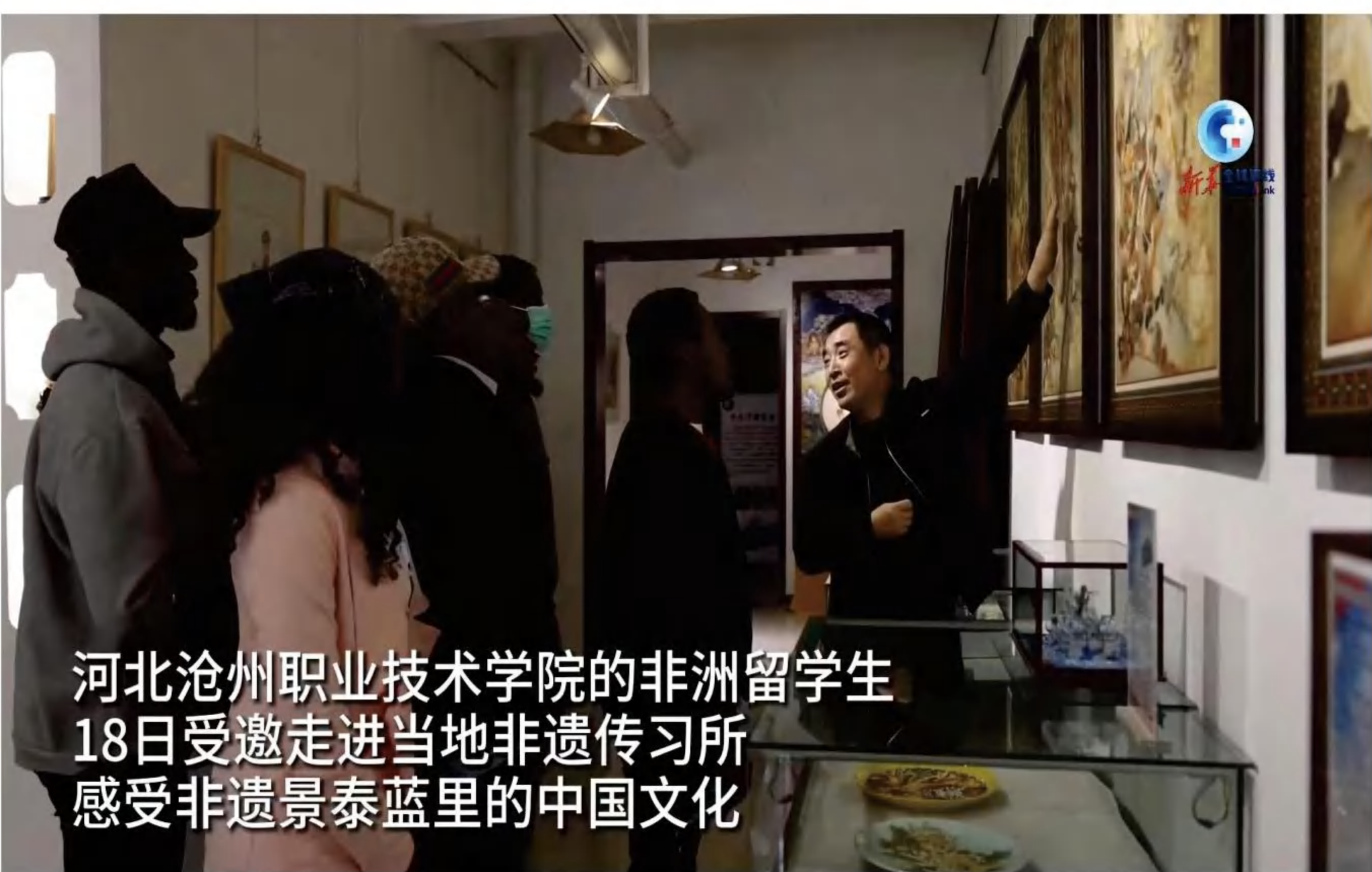
河北沧州职业技术学院的非洲留学生 18日受邀走进当地非遗传习所 感受非遗景泰蓝里的中国文化