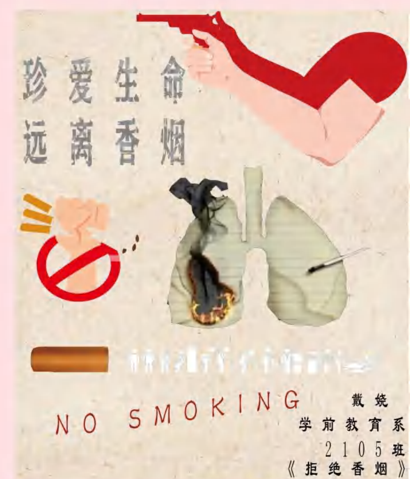
学前教育系2105班戴烧