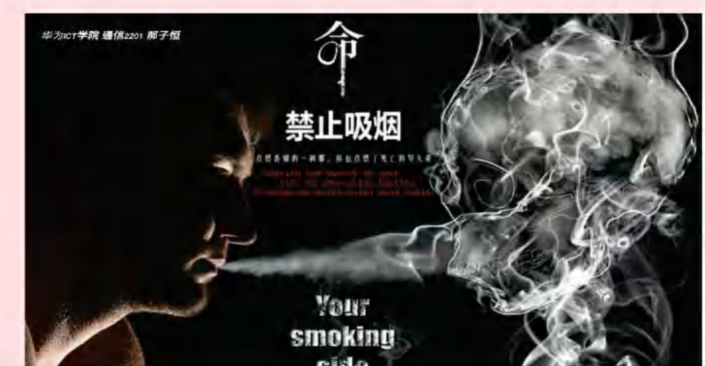
华为ICT学院 通信2201 郝子恒