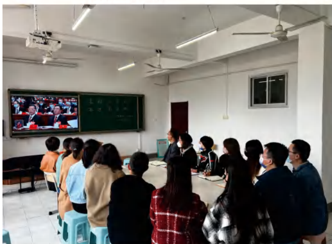
学前系辅导员集中收看