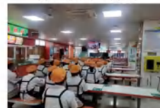
食堂职工集中收看