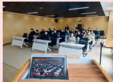
实训基地管理办公室