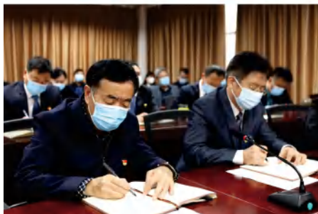
学院领导收看大会直播