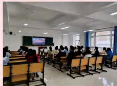
渤海校区(南院)师生