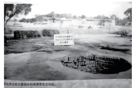
华北民众抗日救国军成立遗址