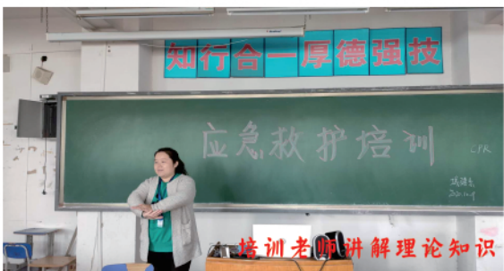
培训老师讲解理论知识