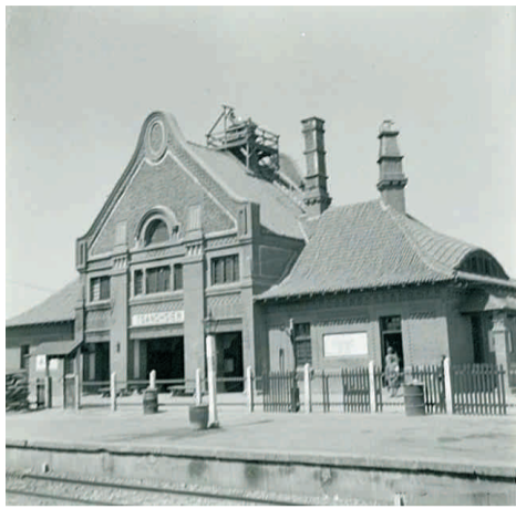
始建于宣统元年（1909年）的沧州火车站