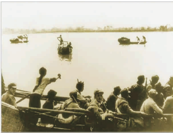
《我送亲人过大江》