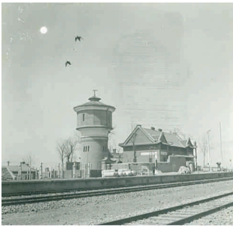
民国时期的捷地火车站