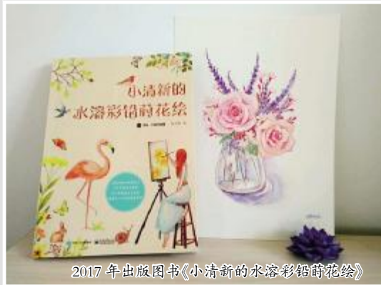
2017年出版图书《小清新的水溶彩铅画》