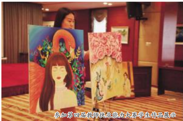
参加第四届教师执业能力大赛学生作品展示