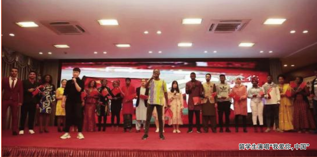
留学生演唱“我爱你,中国”