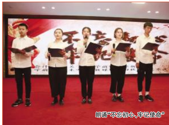
朗诵“不忘初心、牢记使命”