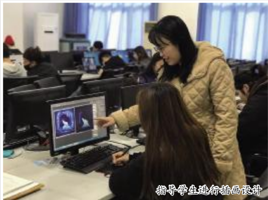
指导学生进行插画设计