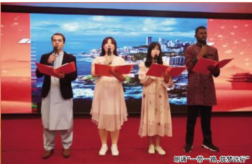
朗诵“一带一路,筑梦远行”