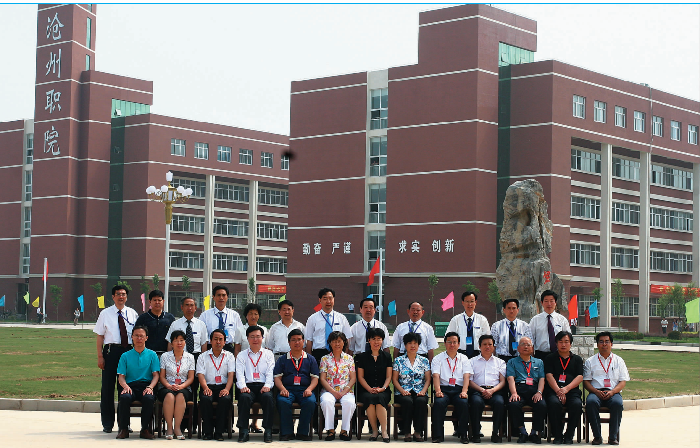
省市领导、专家组、学院领导班子成员合影