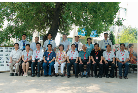
专家与乌克兰外教合影