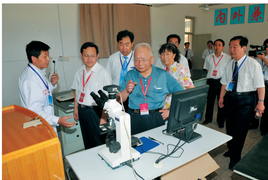
考察畜牧兽医系生物实验室