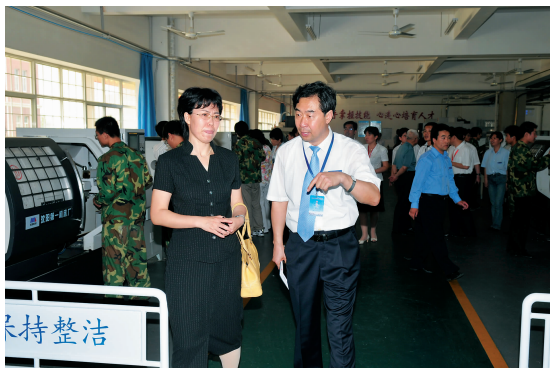
考察机电系数控车间