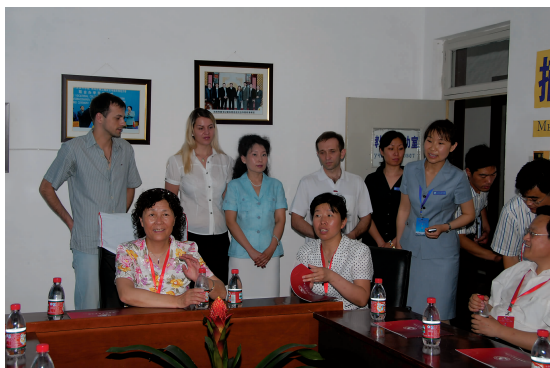
专家与外教亲切交谈