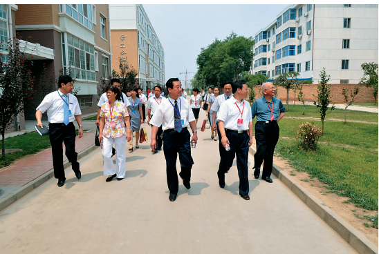
专家参观考察学生公寓及校园环境